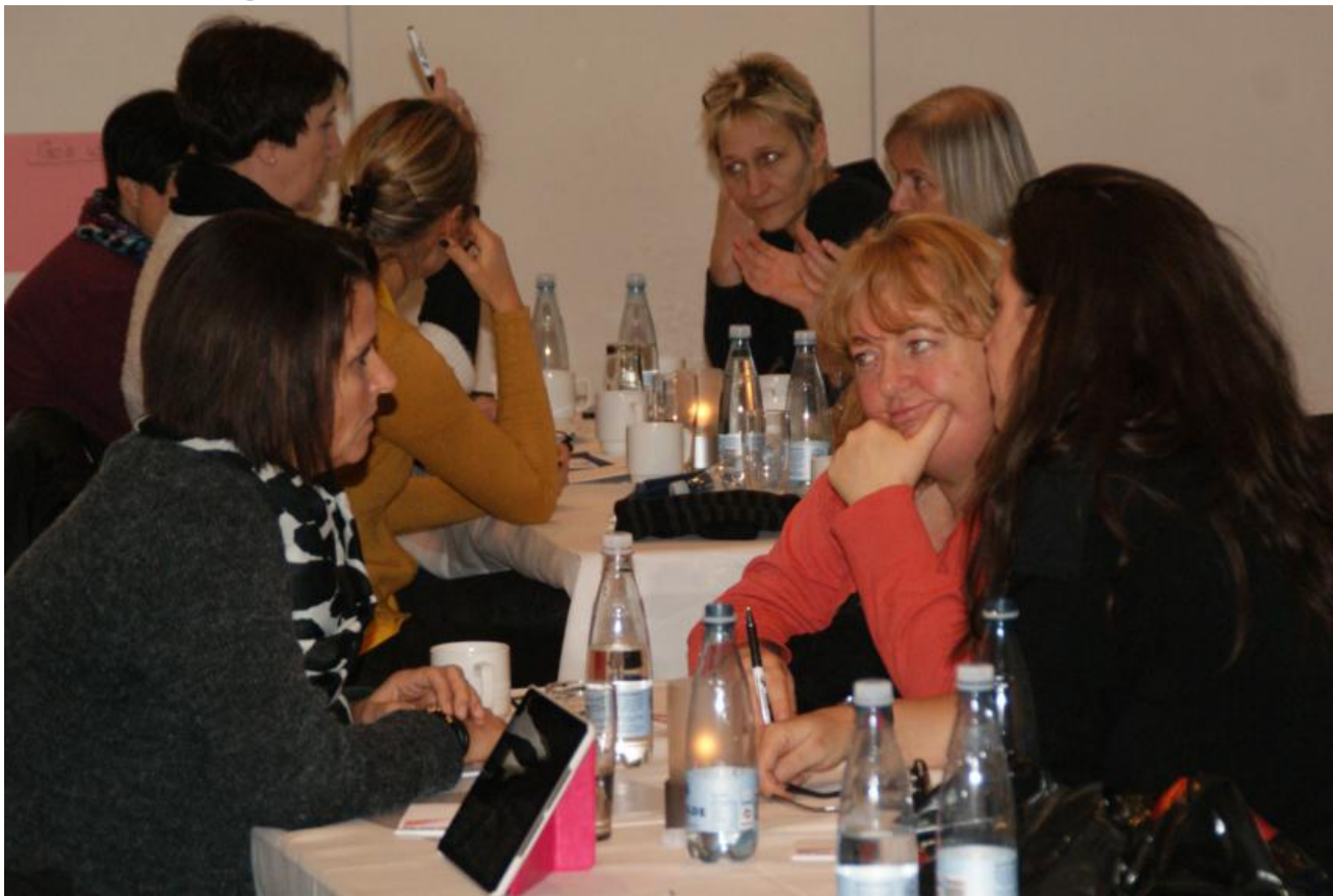
Intensiv dialog om den nye afdeling, på personalekonferencen den 25/11 2014

Gennem første halvår af 2015 gennemfører formandskabet samtaler med alle ansatte, om deres ønsker til arbejdsfunktioner, jobindhold, udviklingsmuligheder og meget andet.